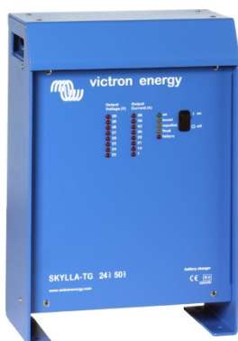
Cargador Skylla 24V 50A