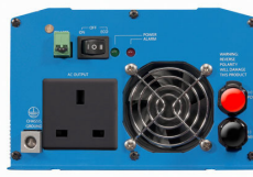
Phoenix Inverter 12/800 with BS 1363 socket