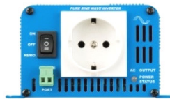
Phoenix Inverter 12/180 with Schuko socket