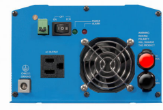
Phoenix Inverter 12/800 with Nema 5-15R socket