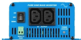
Phoenix Inverter 12/350 with IEC-320 sockets