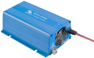
Phoenix Inverter 12/180