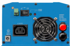
Phoenix Inverter 12/800 with IEC-320 socket