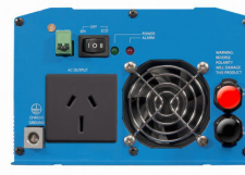
Phoenix Inverter 12/800 with AN/NZS 3112 socket