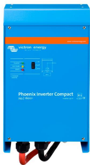
Phoenix Inverter Compact 24/1600

Todos los modelos disponen de un Puerto RS-485. Todo lo que necesita conectar a su PC es nuestro interfaz MK2 (ver el apartado "Accesorios"). Este interfaz se encarga del aislamiento galvánico entre el inversor y el ordenador, y convierte la toma RS-485 en RS-232. También hay disponible un cable de conversión RS-232 en USB. Junto con nuestro software VEConfigure , que puede descargarse gratuitamente desde nuestro sitio Web www.victronenergy.com , se pueden personalizar todos los parámetros de los inversores. Esto incluye la tensión y la frecuencia de salida, los ajustes de sobretensión o subtensión y la programación del relé. Este relé puede, por ejemplo, utilizarse para señalar varias condiciones de alarma distintas, o para arrancar un generador. Los inversores también pueden conectarse a VENet , la nueva red de control de potencia de Victron Energy, o a otros sistemas de seguimiento y control informáticos.